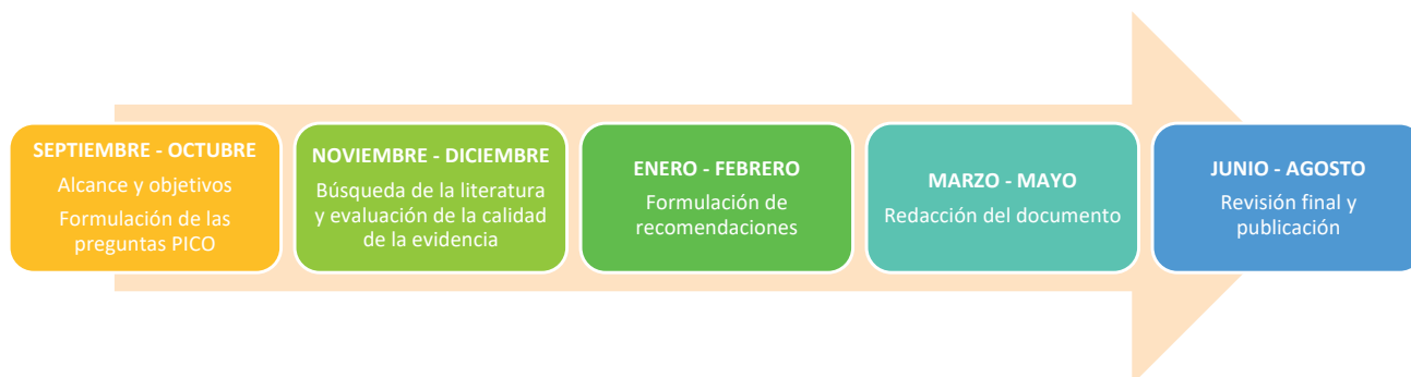
Figura 2. Metodología de elaboración de la guía. Elaboración propia.

La guía fue elaborada de septiembre de 2023 a agosto de 2024. (Figura 2)